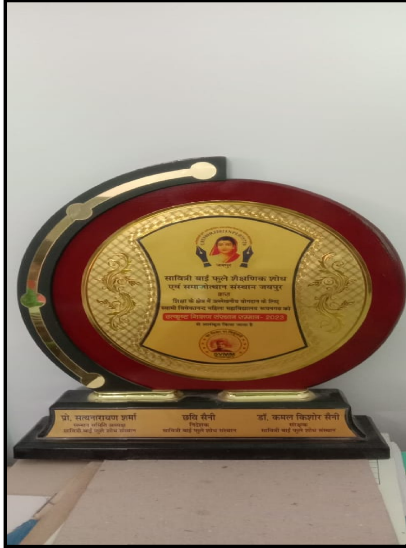
Appreciation Award from Savitri Bai Fule Education Research institute, Jaipur

E-Mail Id: - svmmcollege.roopangarh@gmail.com