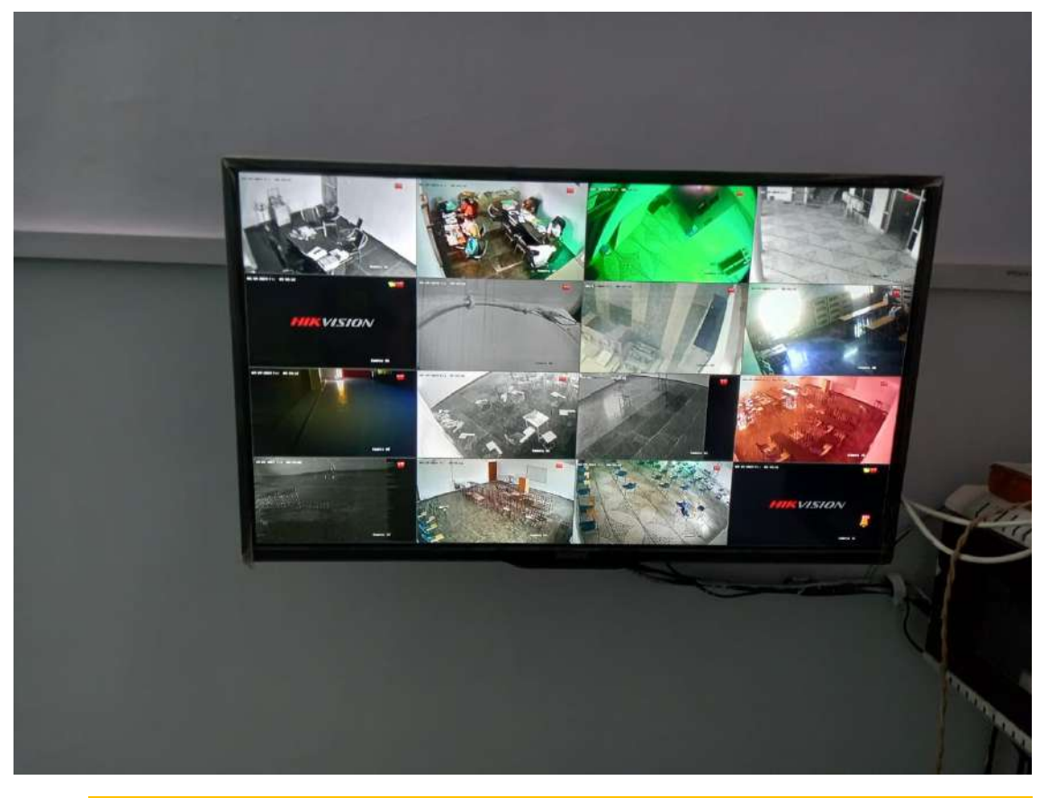
CCTV Surveillance of All Cameras through Principal Office