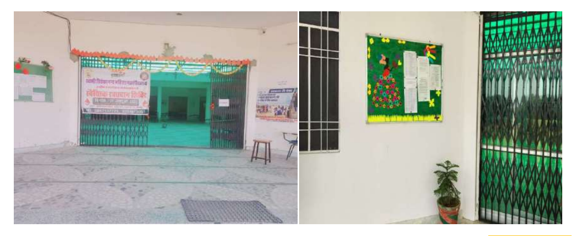
Snap Shot of Notice Board