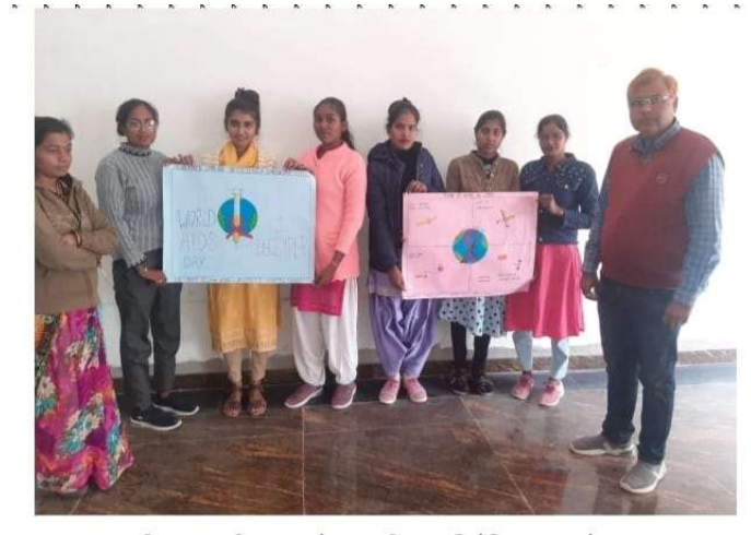
विश्व एड्स दिवस पर पोस्टर व निबन्ध प्रतियोगिता का आयोजन

Poster making competition on WORLD AIDS DAY