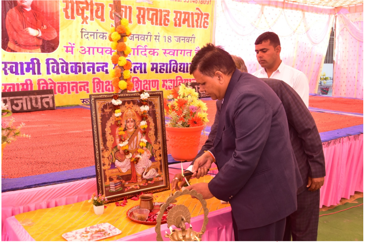
महाविद्यालय सचिव द्वारा दीप प्रज्ज्वलन करते हुए