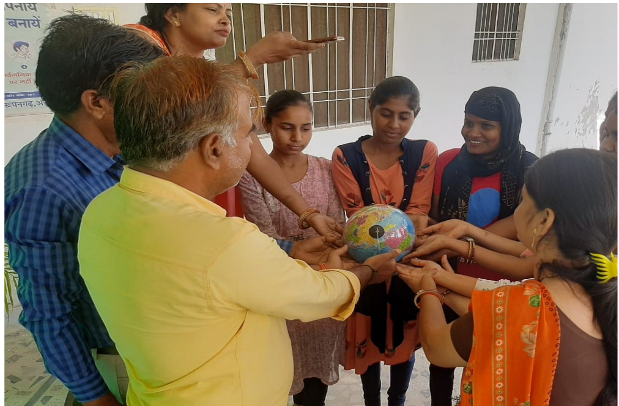
विश्व ओजोन दिवस