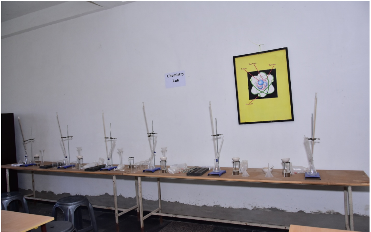
रसायन विज्ञान प्रयोगशाला