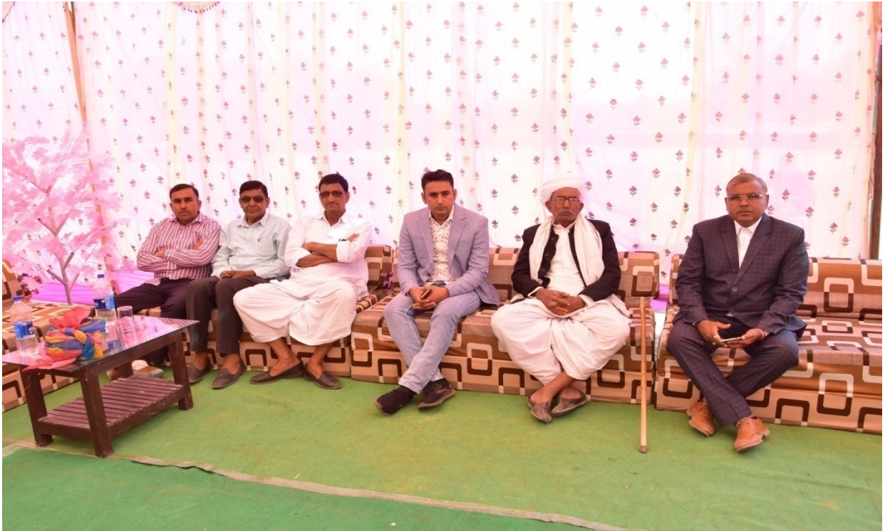
समारोह में उपस्थित अतिथि गण