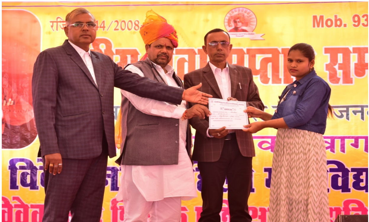
अथितियों द्वारा प्रतिभागियों को पुरस्कार वितरण करते हुए