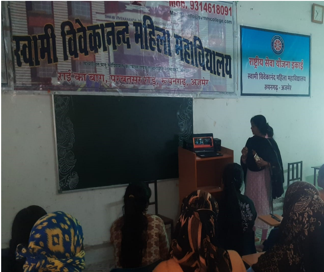
एन.एस.एस. इकाई संगोष्ठी का आयोजन

स्वामी विवेकानन्द महिला महाविद्यालय, रूपनगढ़ में 10 अगस्त 2023 से राष्ट्रीय सेवा योजना इकाई संचालित है। जिसमें कुल 100 स्वयं सेवक नामांकित हैं। महाविद्यालय प्रांगण में एन.एस.एस. इकाई से ज्यादा से ज्यादा जुड़ने के लिए अभिप्रेरित करने के लिए संगोष्ठी का आयोजन किया गया। जिसमें समाज सेवा के माध्यम से विद्यार्थियों का व्यक्तित्व और चरित्र निर्माण पर विशेष जोर दिया गया। इस संगोष्ठी में राष्ट्रीय योजना सेवा योजना के बारे में विस्तृत जानकारी साझा की गई:—