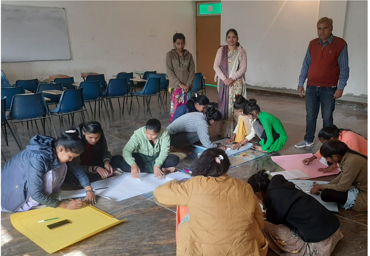
विश्व एड्स दिवस पर पोस्टर व निबन्ध प्रतियोगिता का आयोजन