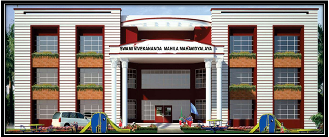
महाविद्यालय का प्रस्तावित भवन

महाविद्यालय का वर्तमान भवन 31000 वर्गगज क्षेत्र में बना हुआ है जिसमें 17 सुसज्जित कक्षा कक्ष 30X30 साइज के तथा सभी संसाधनों से युक्त गृहविज्ञान एवं भूगोल प्रयोगशालाए, सेमीनार हॉल, विशाल पुस्तकालय,वाचनालय, बुक बैंक एवं कम्प्यूटर प्रयोगशाला मौजूद है। वर्तमान भवन में एक 50X50 का 200 सीट्स सुविधा युक्त सेमीनार हॉल उपलब्ध है। महाविद्यालय में खेलकूद कक्ष एवं स्टोर हेतु भी अतिरिक्त कक्ष उपलब्ध है। महाविद्यालय परिसर में वॉलीबाल, बैडमिन्टन, खो-खो, कबड्डी, क्रिकेट इत्यादि आडटडोर गेम्स एवं केरम, शतरंज, टेबल टेनिस जैसे इन्डोर गेम्स की सुविधायें मौजूद है। महाविद्यालय का विशाल उद्यान महाविद्यालय की शोभा मे चार चांद लगाता है।