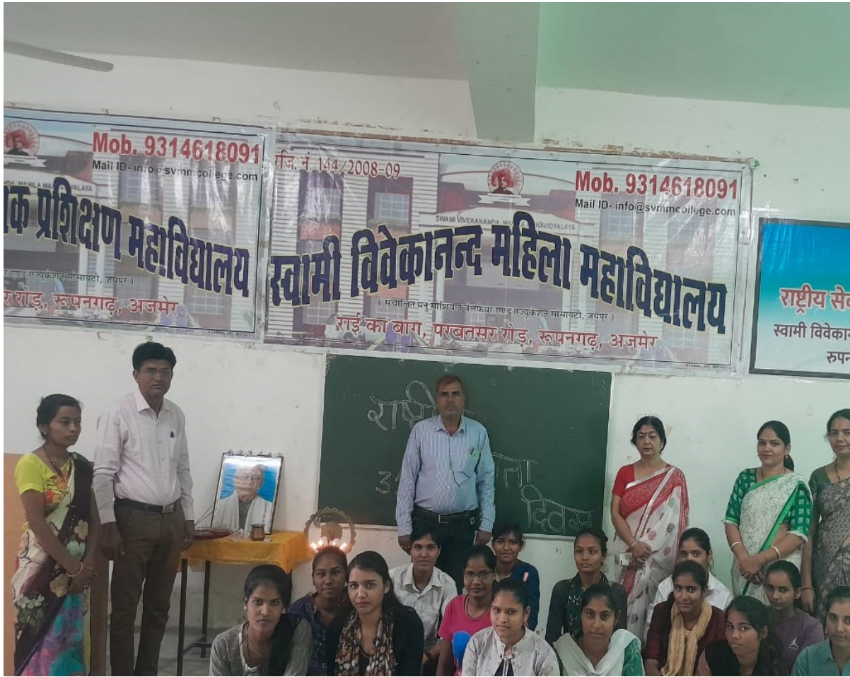
राष्ट्रीय एकता दिवस