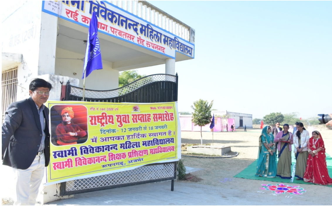
मेहमानों का इंतजार करते हुए सभी विशिष्ट गण एवं कॉलेज परिवार