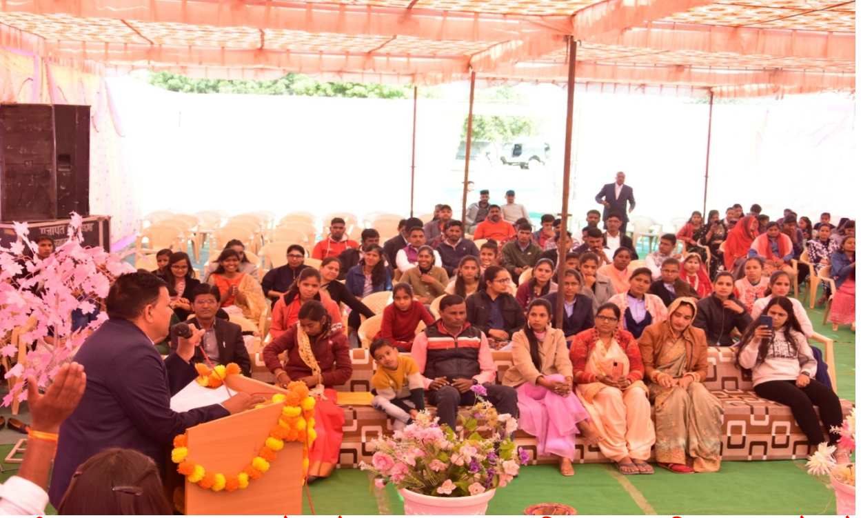
राष्ट्रीय युवा सप्ताह समारोह के अवसर पर महाविद्यालय सचिव छात्राओं को सम्बोधित करते हुए ।