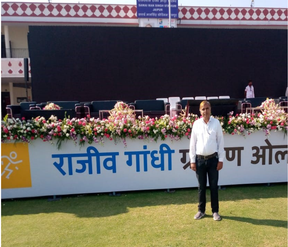
ओलम्पिक खेल में महाविद्यालय प्राचार्य की उपस्थिति