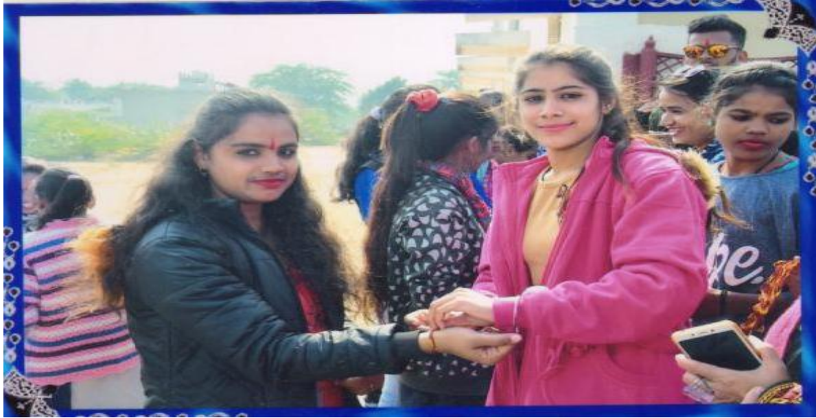
सीनियर छात्राओं द्वारा नवप्रवेशित छात्राओं का तिलक करते हुए