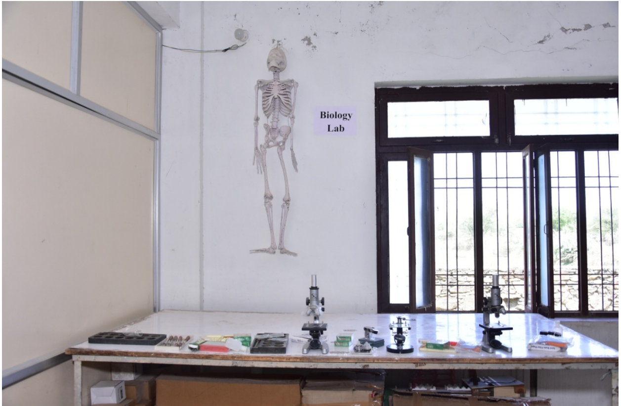
जीव विज्ञान प्रयोगशाला