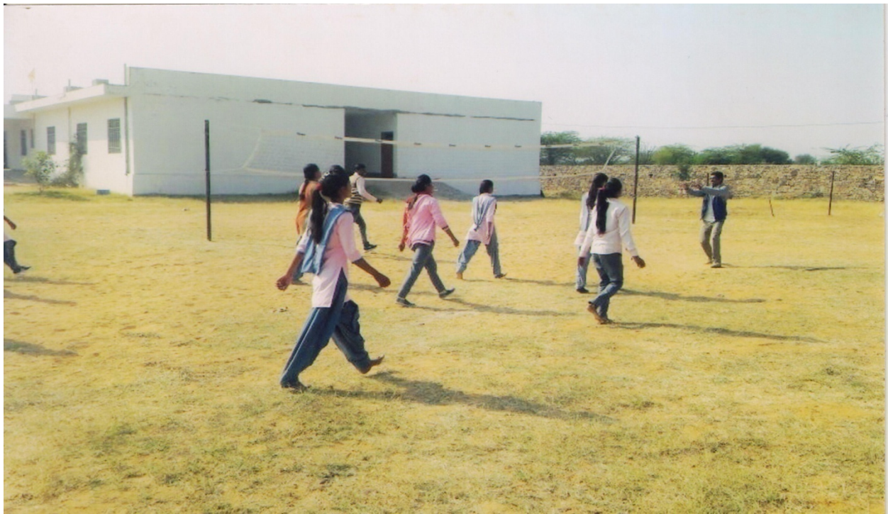
महाविद्यालय का खेल मैदान