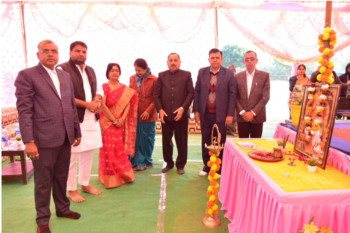
दीप प्रज्ज्वलन करते हुए