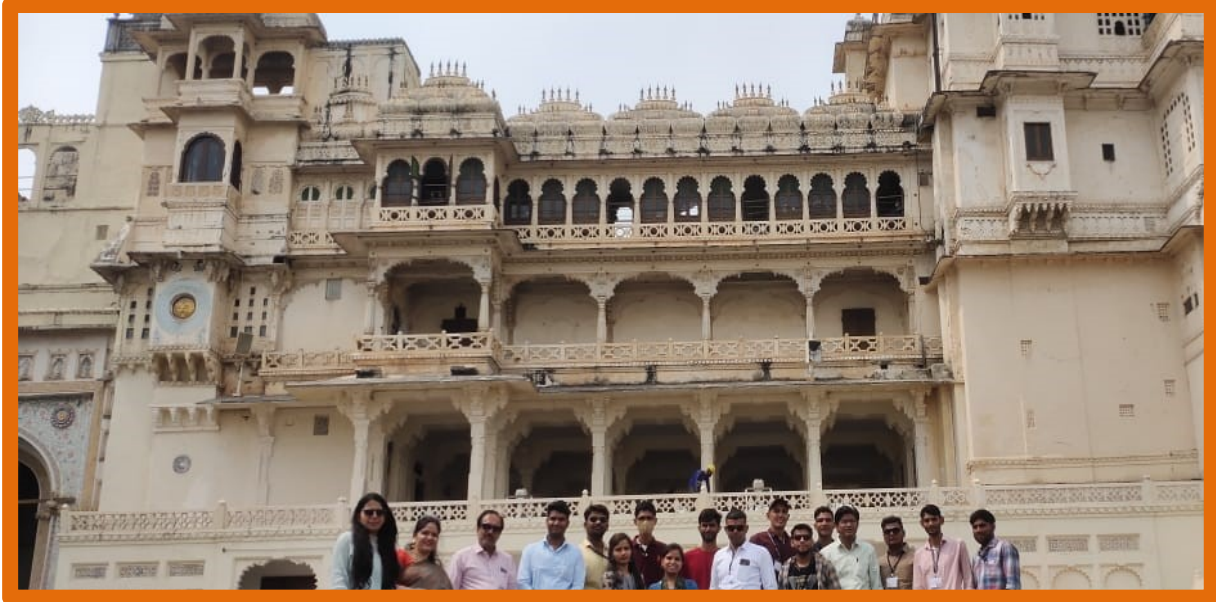
उदयपुर सिटी पेलेस