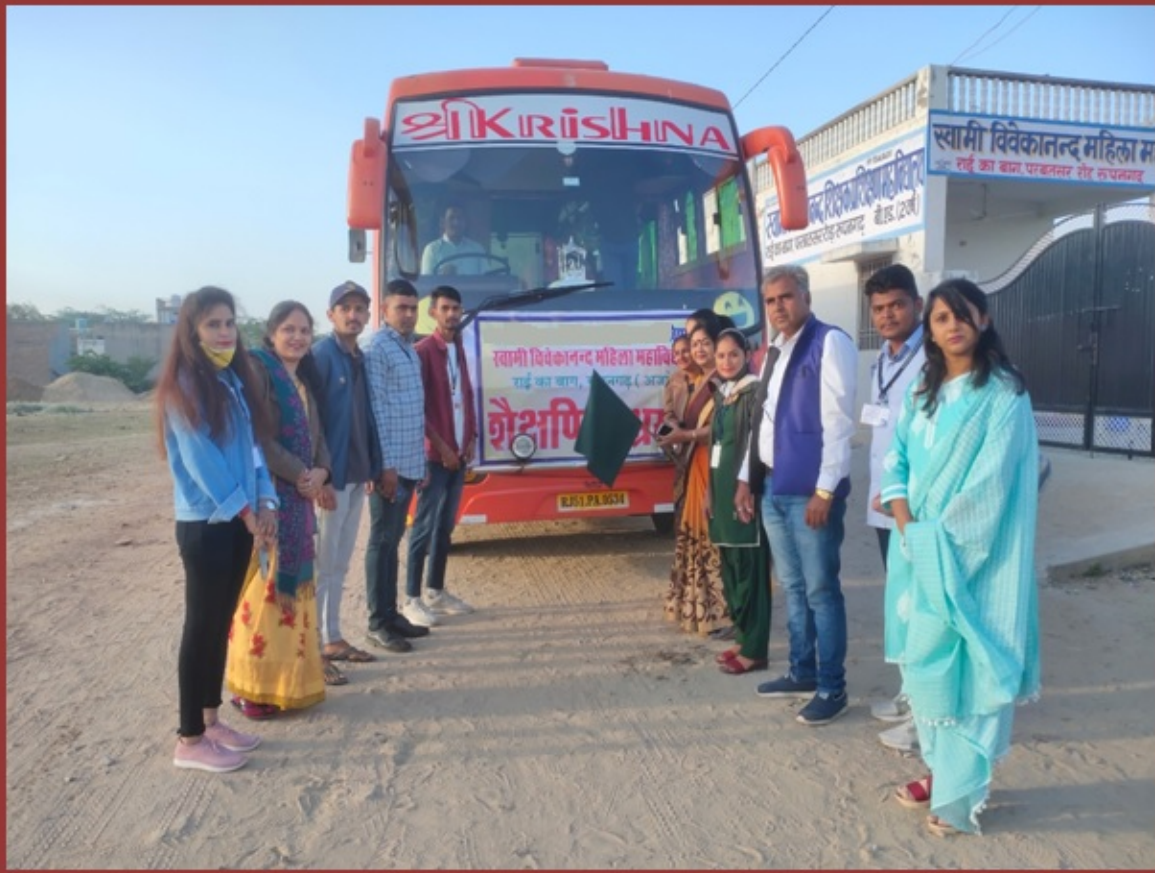
शैक्षणिक भ्रमण के लिए रवाना होते हुए