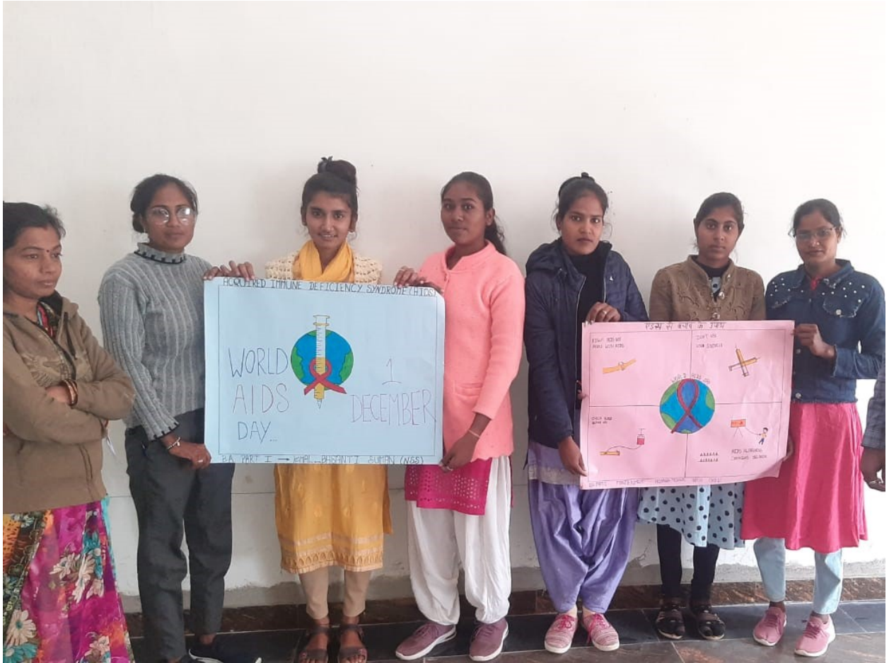
विश्व एड्स दिवस पर पोस्टर व निबन्ध प्रतियोगिता का आयोजन