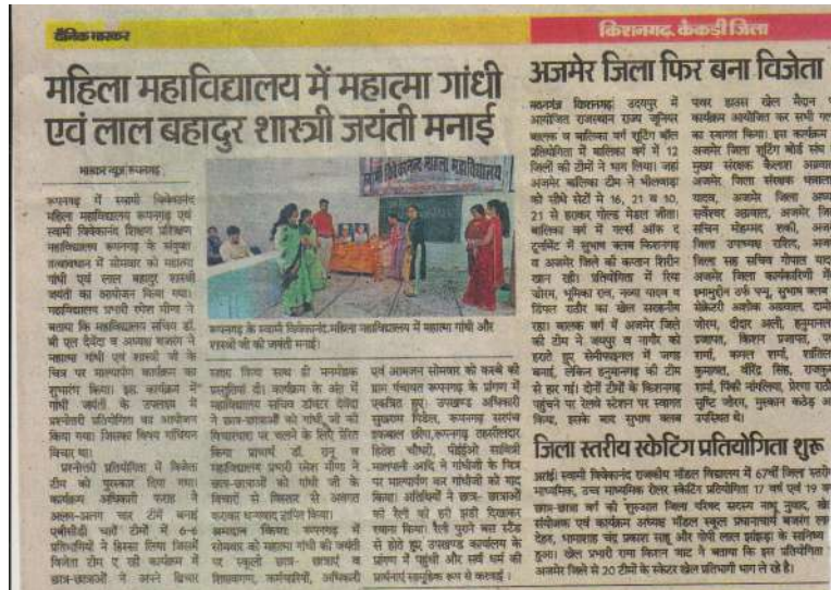
Dainik Bhaskar Press News 03.10.2023