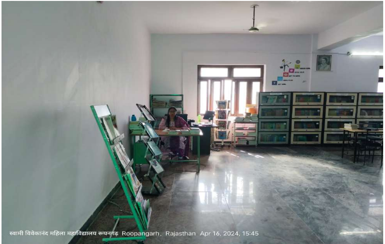
स्वामी विवेकानंद महिला महाविद्यालय रूपनगढ़ Roopangarh, Rajasthan Apr 16, 2024, 15:45