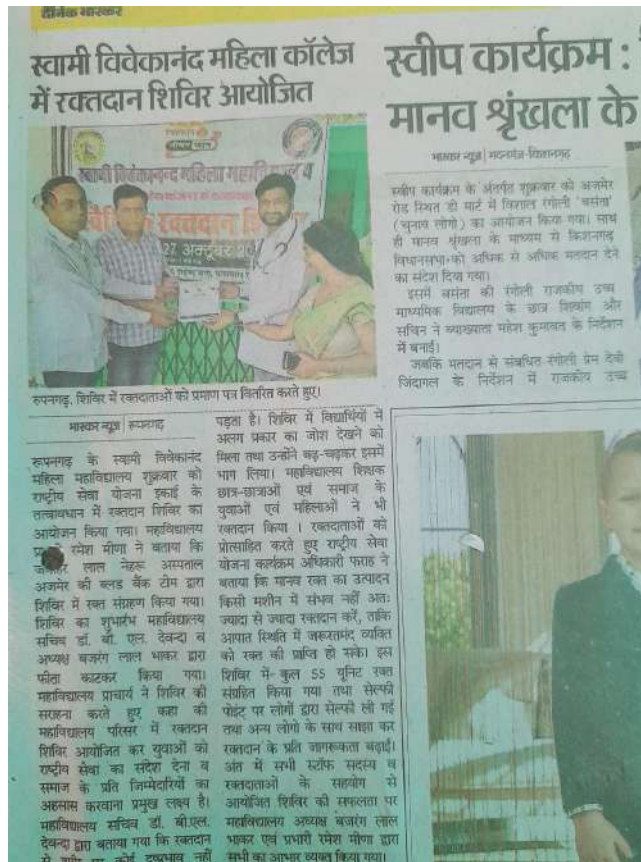
Press News Dainik Bhaskar dated 28.10.2023