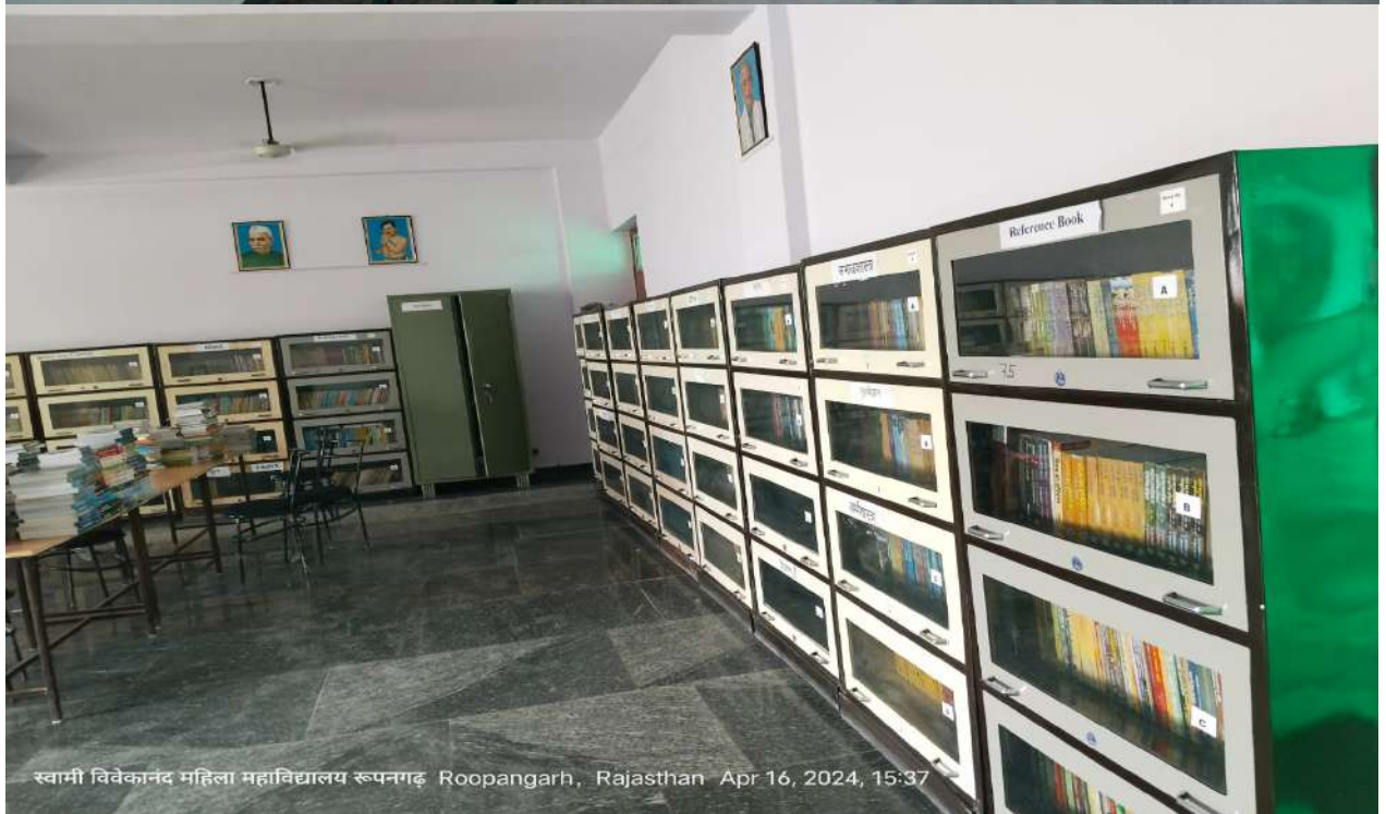
स्वामी विवेकानंद महिला महाविद्यालय रूपनगढ़ Roopangarh, Rajasthan Apr 16, 2024, 15:37