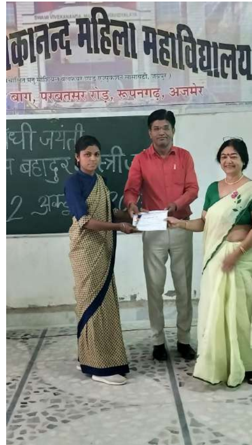
Glimpse of Certificate Distribution