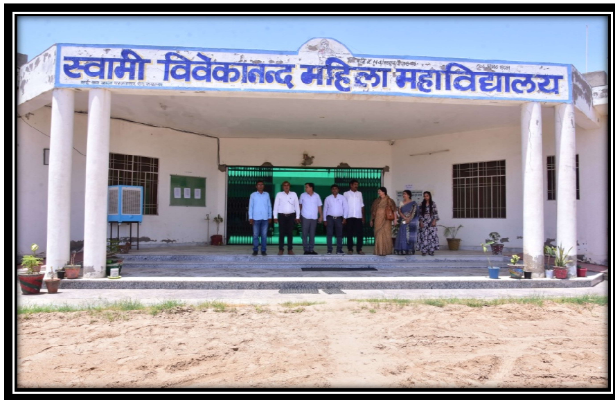
महाविद्यालय का भवन

महाविद्यालय का वर्तमान भवन 31000 वर्ग गज क्षेत्र में बना हुआ है जिसमें 17 सुसज्जित कक्षा कक्ष 30X30 साइज के तथा सभी संसाधनों से युक्त गृहविज्ञान एवं भूगोल प्रयोगशालाए, सेमीनार हॉल, विशाल पुस्तकालय, वाचनालय, बुक बैंक एवं कम्प्यूटर प्रयोगशाला मौजूद है। वर्तमान भवन में एक 50X50 का 200 सीट्स सुविधा युक्त सेमीनार हॉल उपलब्ध है। महाविद्यालय में खेलकूद कक्ष एवं स्टोर हेतु भी अतिरिक्त कक्ष उपलब्ध है। महाविद्यालय परिसर में वॉलीबाल, बैडमिन्टन, खो-खो, कबड्डी, क्रिकेट इत्यादि आडटडोर गेम्स एवं केरम, शतरंज, टेबल टेनिस जैसे इन्डोर गेम्स की सुविधायें मौजूद है। महाविद्यालय का विशाल उद्यान महाविद्यालय की शोभा मे चार चांद लगाता है।