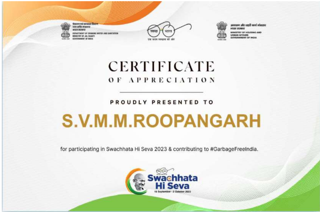
Certificate of Appreciation