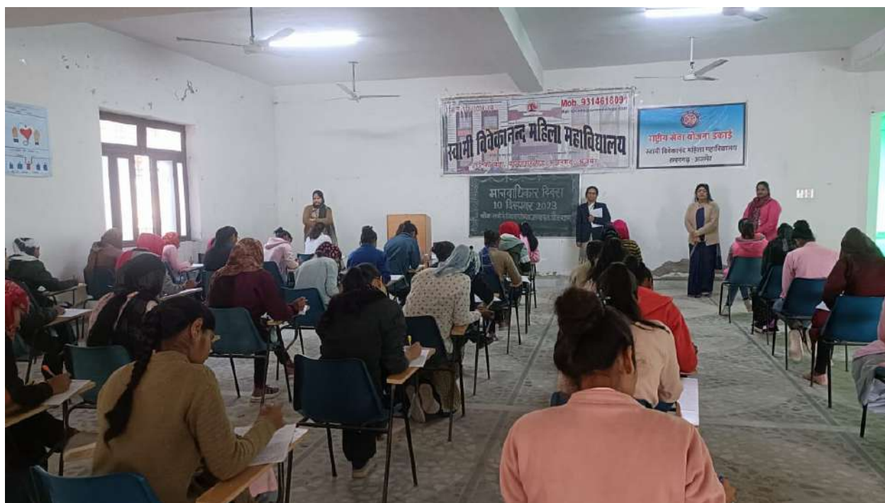
Glimpse of Human Rights Day