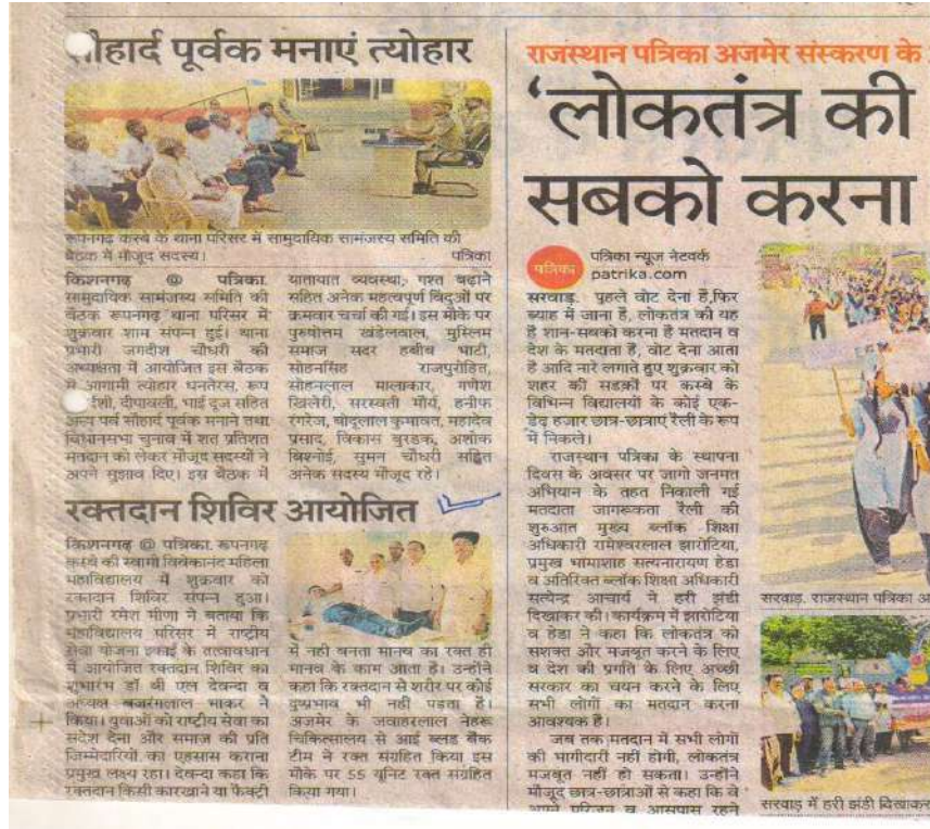
Press News Rajasthan Patrika dated 28.10.2023