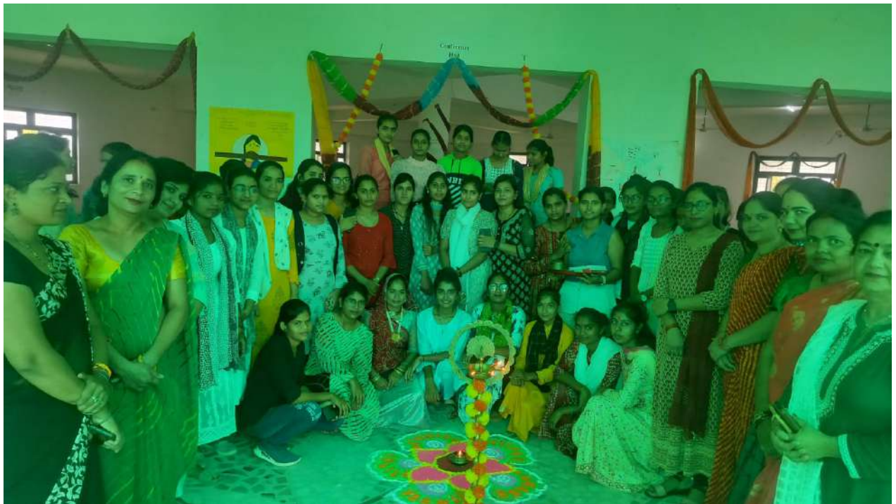
Senior Students Applying Tilak to the Newly Admitted Students