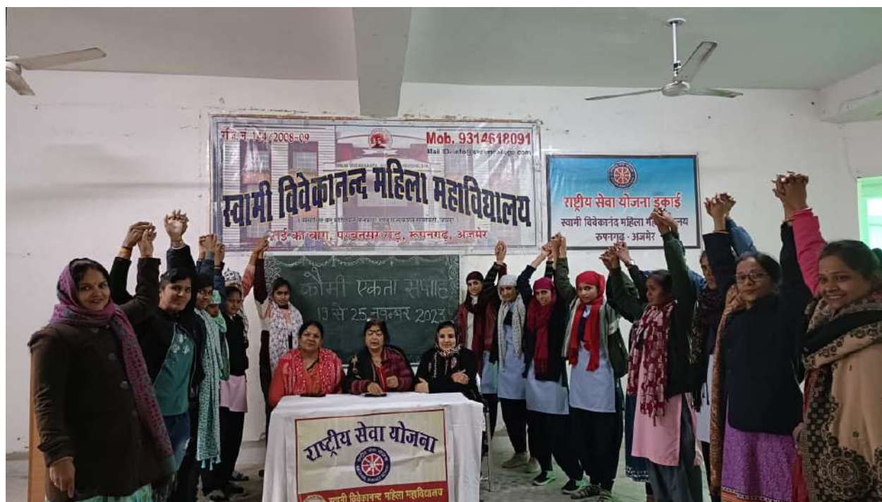
Glipse of Cultural Unity Day

स्वामी विवेकानन्द महिला महाविद्यालय, रूपनगढ़ के राष्ट्रीय सेवा योजना के तत्वाधान में दिनांक 19–25 नवम्बर 2023 तक कौमी एकता सप्ताह मनाया गया। इस सप्ताह के अन्तर्गत राष्ट्रीय एकता, धर्म निरपेक्षता एवं अहिंसावादी विचारों के प्रसार हेतु विचार गोष्ठीयाँ आयोजित की गईं। सांस्कृतिक एकता को प्रोत्साहित एवं उन्नत करने के लिए विभिन्न कार्यक्रम आयोजित किये गये। स्वयं सेविकाओं एवं अन्य छात्राओं को राष्ट्रीय एकता की शपथ ग्रहण कराई गई। कार्यक्रम प्रभारी द्वारा स्वयं सेविकाओं को सोशल मीडिया के सकारात्मक उपयोग संबंधी जानकारी दी गई तथा फेक न्यूज प्रसार की रोकथाम हेतु उपाय बताये गये ताकि समाज में शांति समरसता का वातावरण बना रहे।